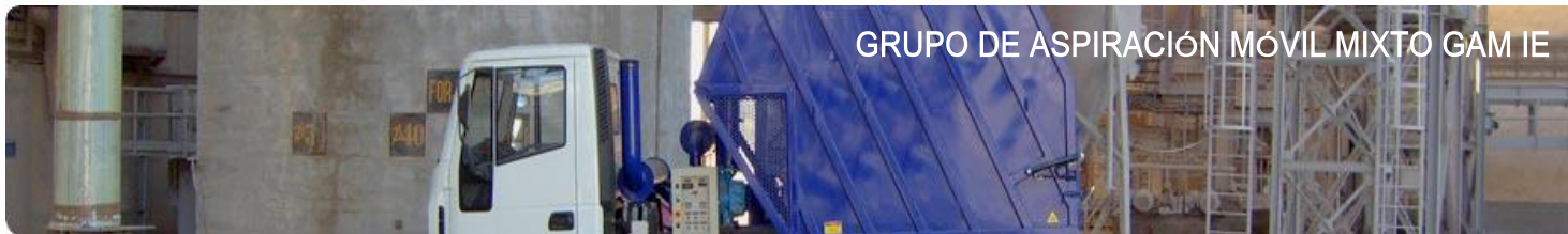
GRUPO DE ASPIRACIÓN MÓVIL MIXTO GAM IE

Descubra las ventajas que los productos de Ecogam pueden aportar a su negocio. Le ayudamos a eliminar todo tipo de polvos, arenas, gravas o cualquier otro derrame sólido de las diferentes zonas del proceso de producción, permitiendo el trasladando de los mismos a la zona de vertidos o estocaje, así como el bombeo del material para su recuperación. Podrá obtener un entorno limpio y ecológico en un tiempo record, reduciendo significativamente sus costes de explotación y mantenimiento.