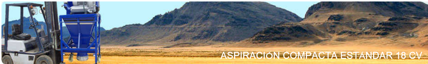
ASPIRACIÓN COMPACTA ESTANDAR 18 CV

Descubra las ventajas que los productos de Ecogam pueden aportar a su negocio. Le ayudamos a eliminar todo tipo de polvos, arenas, gravas o cualquier otro derrame sólido de las diferentes zonas del proceso de producción, permitiendo el trasladando de los mismos a la zona de vertidos o estocaje. Podrá obtener un entorno limpio y ecológico en un tiempo record, reduciendo significativamente sus costes de explotación y mantenimiento.