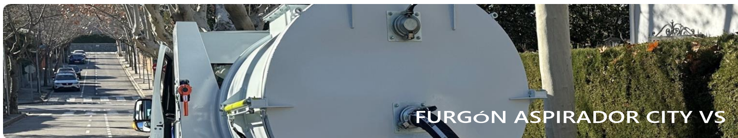
FURGÓN ASPIRADOR CITY VS

Descubra las ventajas que los productos de Ecogam pueden aportar a su negocio. Le ayudamos a eliminar todo tipo de polvos, arenas, gravas o cualquier otro derrame sólido de las diferentes zonas del proceso de producción, permitiendo el trasladando de los mismos a la zona de vertidos, así como la aspiración del material en sacas para su posterior recuperación. Podrá obtener un entorno limpio y ecológico en un tiempo record, reduciendo significativamente sus costes de explotación y mantenimiento.